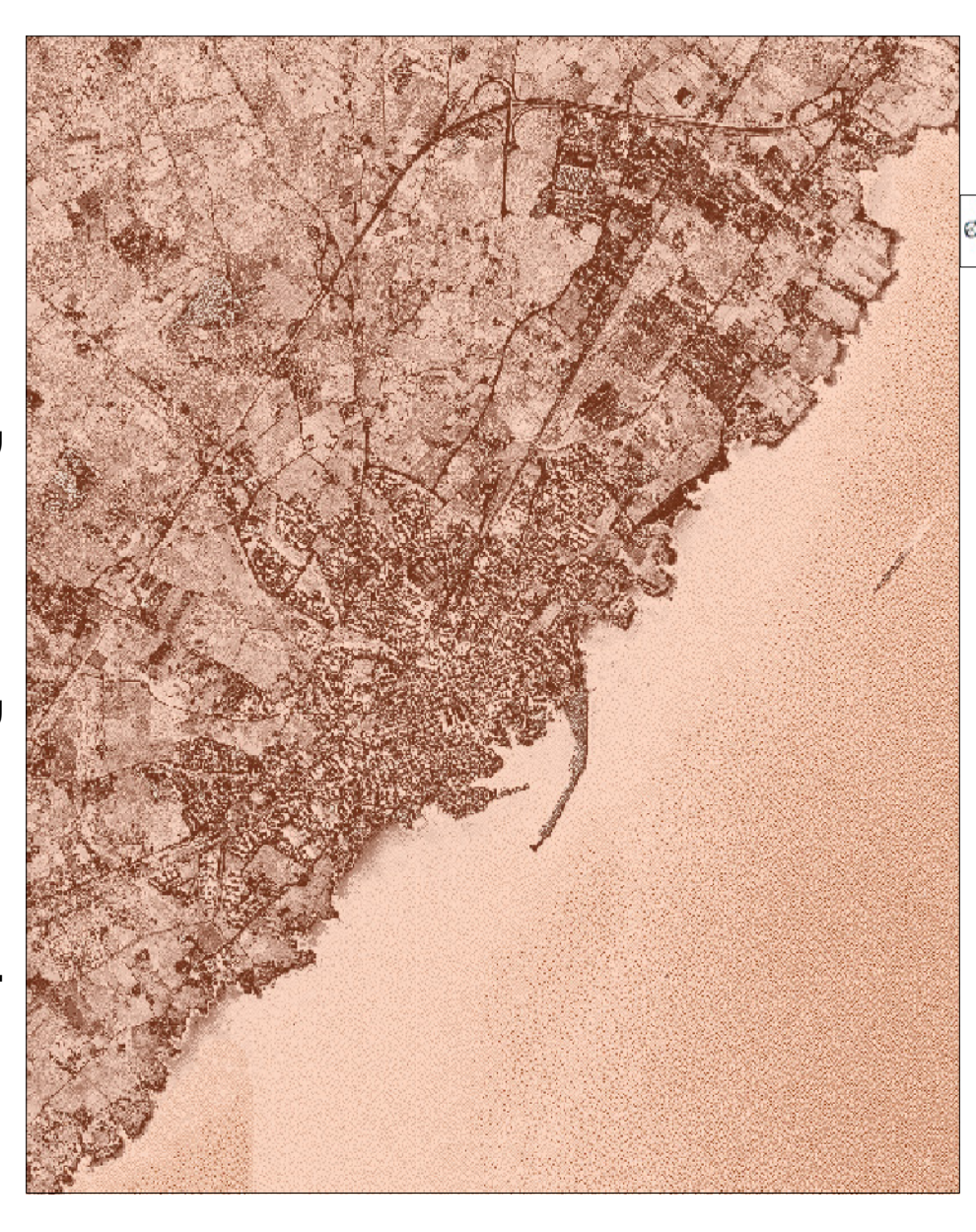
Documento Programmatico Preliminare (DPP)

TAVOLA q.c.5 - VINCOLI DECADUTI Scale 1:5000