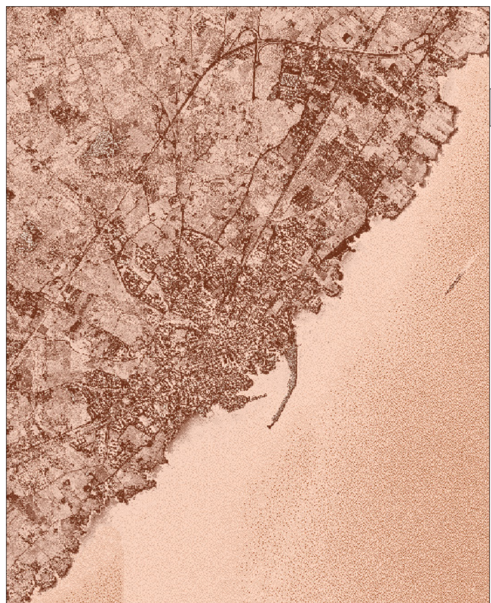
Documento Programmatico Preliminare (DPP)