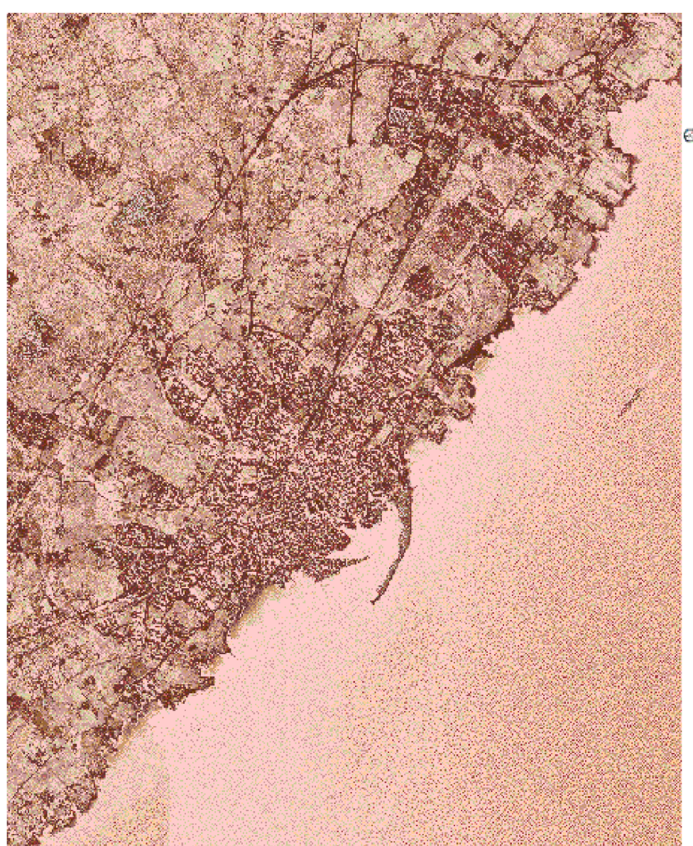
Documento Programmatico Preliminare (DPP)